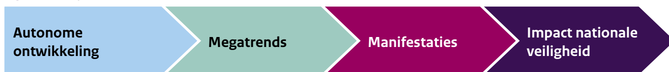
Figuur 2 Analyseketen

De eerste ronde van scans levert een longlist op met relevante manifestaties per megatrend. Vervolgens wordt aan de hand van de verwachte en ingeschatte impact op nationale veiligheid een zogenaamde 'mediumlist' samengesteld. De criteria hiervoor zijn een inschatting van de waarschijnlijkheid en impact van een manifestatie op de zes nationale veiligheidsbelangen (territoriale veiligheid, fysieke veiligheid, economische veiligheid, ecologische veiligheid, sociaal-maatschappelijke stabiliteit en bescherming van de internationale rechtsorde). Deze mediumlist wordt vervolgens in expertsessies bediscussieerd.